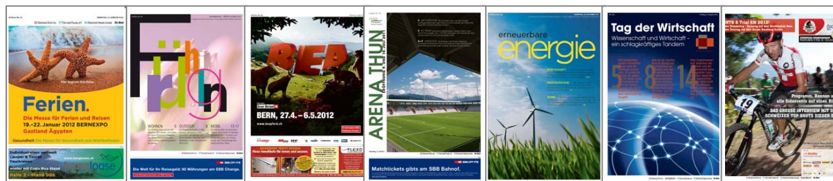
Anzeigenformate Breite x Höhe in mm

Nebst unseren Trialwettbewerben im Herzen der Stadt Bern und den spannenden Races ums Bundeshaus finden auf dem Gurten auch die legendären Cross Country Elite Rennen statt. Berne à vélo! Unsere Sonderbeilage wird – als EM Ausblick und Programmheft – tausende von Menschen der Stadt und erweiterten Region Bern begeistern. Seien Sie dabei – in unserer attraktiven Sonderbeilage und live am Event!